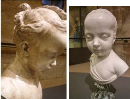
effets ressentis : ils semblent «gentils ? Méchants ?

Content ? Triste ? Fâchés ? ... Laisser s'exprimer