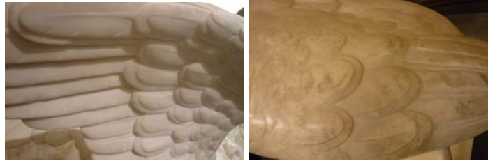
Ailes : Ange,