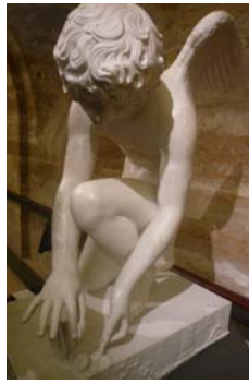
L'amour au papillon Antoine-Denis Chaudet (1817) terre