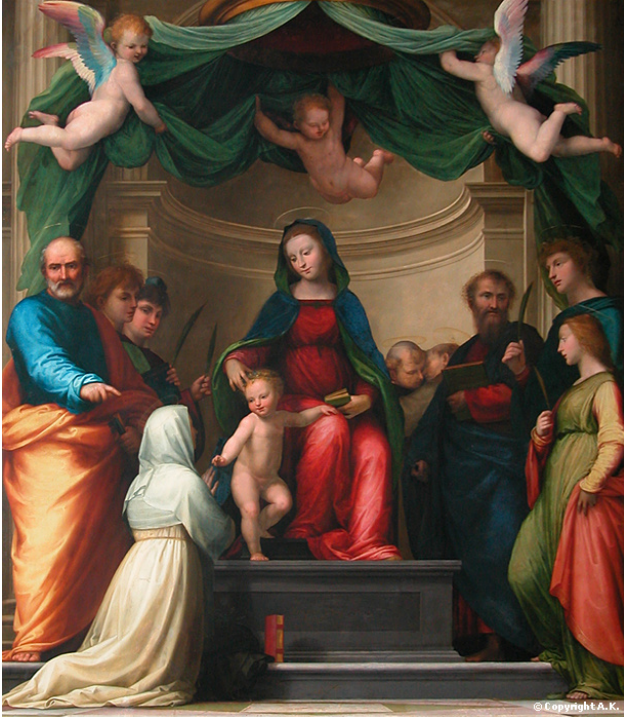
Fra Bartolomeo le mariage mystique de sainte catherine de sienne, 1511 (quelques pas sur la droite en sortant de la salle de la Joconde) Côté droit de la galerie)

- Langage et récit : NARRATION : Raconter, que se passe-t-il ? Que font-ils ? (laisser élèves parler) qui sont-ils ? Que font-ils ensemble ? Qui est cette femme ? Que fait-elle ?