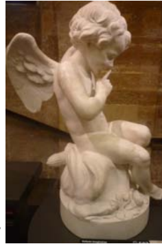
L'amour menaçant (Etienne-Maurice Falconet) 1757 bouche, «chut» .... ou «attention» ? «menaçant» !